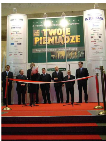
1. Otwarcie Targów Inter Bank 2004r. w Pałacu Kultury i Nauki.

Możliwości wykorzystania form bankowości elektronicznej przez firmy sektora MSP oraz jej bezpieczeństwo były głównym tematem konferencji “Optymalne formy bankowości elektronicznej dla celów biznesowych” zorganizowanej przez Centrum Promocji Informatyki 14 października 2004 r. Impreza towarzyszyła targom Inter Bank 2004.